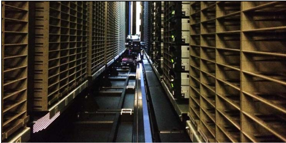
Wendingweg 10: Neue ungefüllte Library, Feb. 15